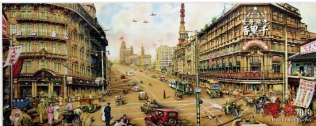
新书的旧上海绘图。